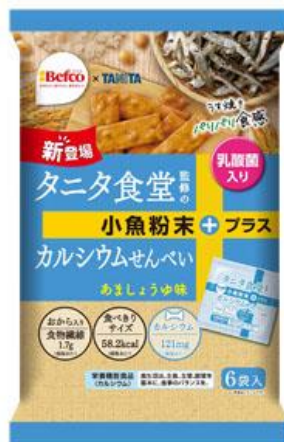
タニタ食堂監修のカルシウムせん

本商品は、生地「おから」を練りこみ、カルシウム含有量が多い小魚粉末などを加えた 栄養機能食品 です。さらに、「乳酸菌」もプラスしており、より健康を意識した商品になっております。2020年9月7日発売。