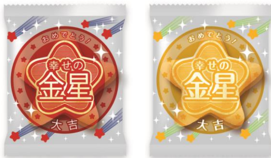
金星個装が入っていたらラッキー！

星たべよハッシュタグキャンペーンを実施しております。「幸せの金星」個装を見つけたら、“幸せの金星”が写った写真をハッシュタグ「#幸せの金星」を付けて、Twitter や Instagram に投稿。毎月抽選で 10 名様に素敵なプレゼントが当たります。詳しくは「星たべよ」で検索。皆様の投稿をお待ちしております。