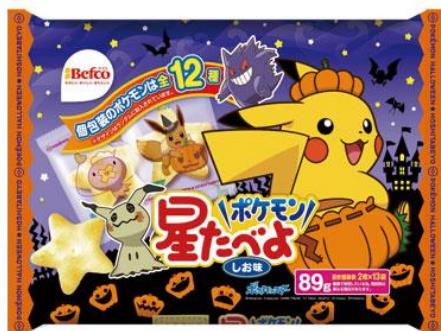
2020HW星たべよ (ポケモン)