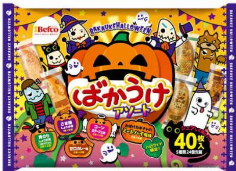
2020HWばかうけアソート

大きいかぼちゃのデザインがひと際目立つ賑やかなパッケージに仕上げました。個包装にもこだわり、様々なコスチュームを纏ったキャラクターがデザインされております。さらに、青のりしょうゆ味、ごま揚しょうゆ味、コーンポタージュ味、甘口カレー味に加えて、ハロウィンアソート限定「ミートパイ風味」と5種類の味の展開になっており、様々な味のばかうけを楽しむことができます。配って嬉しい2020HWばかうけアソートを是非お楽しみ下さい。