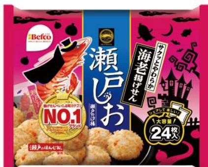
2020HW星たべよ（ポケモン）

今年で発売15周年を迎えた「瀬戸の汐揚」ブランドから、ハロウィンパッケージが登場致します。「88g 瀬戸の汐揚」のピンクを基調にした、ひと際目立つインパクトのあるデザインに仕上げました。個包装もハロウィンオリジナルデザインになっており、全部で10種類あります。1つの味が24枚入った大容量パックです。