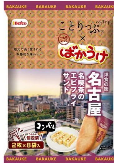
ことりっぷばかうけ(エビフライサンド)