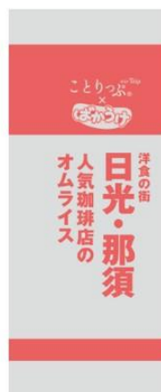
ことりっぷばかうけ(オムライス)