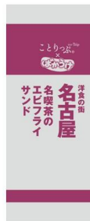
ことりっぷばかうけ(エビフライサンド)